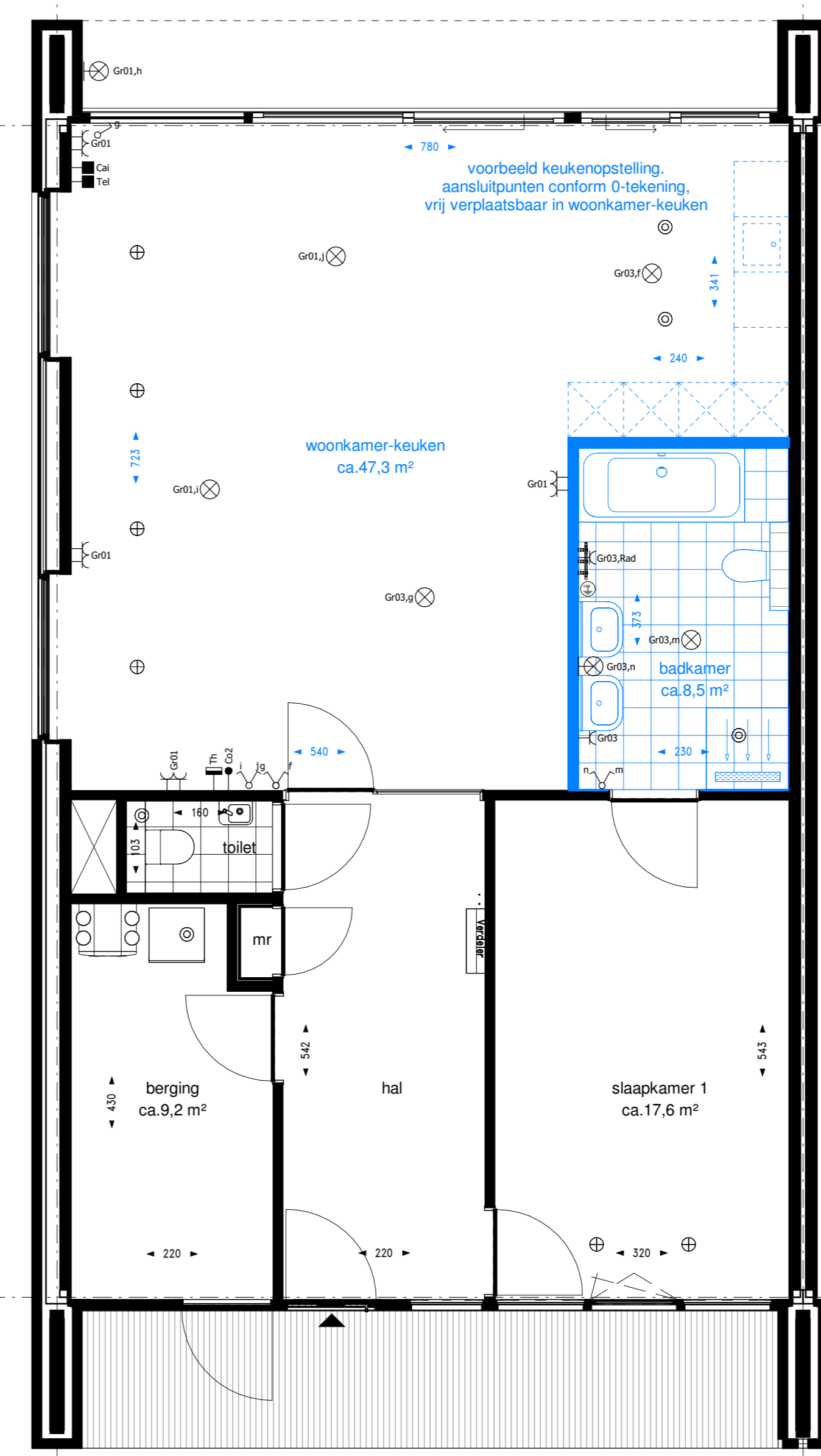
optie B020 + B023: bad en vervallen slaapkamer 2 i.c.m. verplaatsen positie keuken